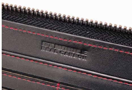
高級感のある本革型押しロゴ