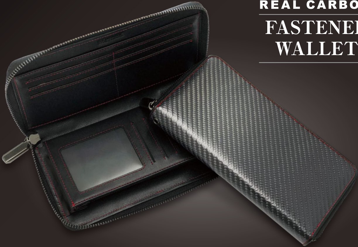
GTR-GT4 ラウンドファスナー長財布 札入れ(2ルーム)、小銭入れ×1、カードポケット×12、多目的ポケット×1 素材:リアルカーボン・本革