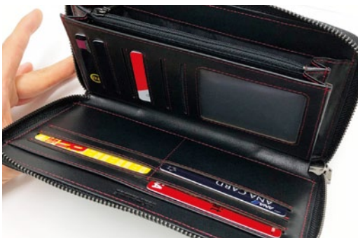
出し入れしやすい大容量収納ルーム